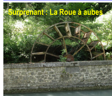
Surprenant : La Roue à aubes

★ Départ / Arrivée : Office de tourisme Le Donjon—Place Mirabeau Tel : 04 90 79 52 29