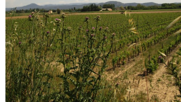
Parcours IVV entre ville et champs