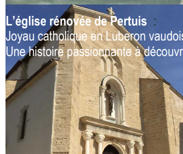
L'église rénovée de Pertuis : Joyau catholique en Luberon vaudois. Une histoire passionnante à découvrir